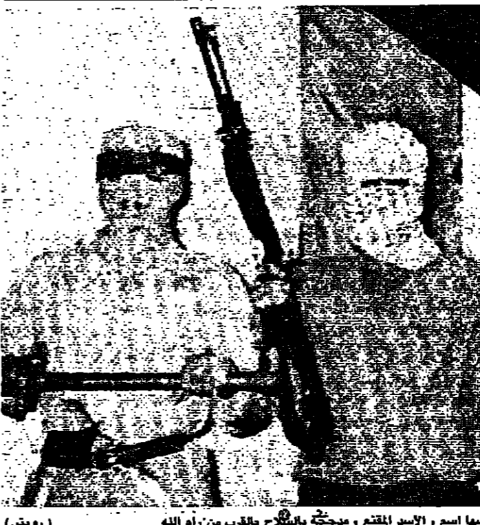
لثلاث اعشاه من قوة تطلق على نفسها اسم الأسد القتم، مسلحة بالبنادق بالقرب من رام الله (رويتز)

خمس اتفاقات تتعلق بتجديد المنتجات الزراعية واتخاذ اجراءات لمنع انتشار الآفات الزراعية وتبني ضمان الضريبي وكافة حرية انتقال البضائع والاستثمار بريا بين الدول الخمس. ويضم الاتحاد المغربي ٦٥ مليون نسمة، ويوزع اجمالي الناتج القومي لدولة الخمس مجتمعة على ١٠٠ مليون دولار سنويا. واستمر اجتماع القمة ما اسماه بالتهديدات والتهديدات التي تواجهها تجمعا موحدا الى امن العالم العربي ككل.